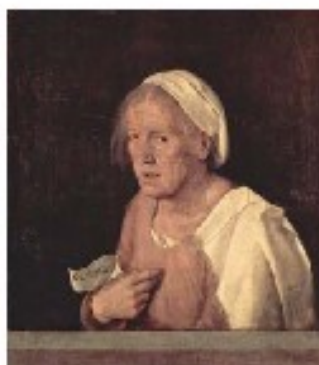
'La vecchia' van Giorgione. © Galerie dell'Accademia, Venetië

T wee foto's vormen het vertrekpunt van de tentoonstelling. Op het linkse beeld, dat dit jaar werd gemaakt, zien we een blad-zijde uit een notitieboekje met een schets van de oude vrouw in 'La vecchia', een werk dat de Italiaanse renaissance-schilder Giorgione rond 1506 maakte. Het is met plakband op een wit schrijfbord vol aantekeningen gekleefd. Een lijn van rode stiften verbindt enkele punten in de tekening en neemt zo de vorm van een bliksem-schicht aan. Horizontale, genummerde lijnen suggereren aandacht voor lagen in het werk. In het schilderij, en dus ook in de schets ervan, hoort de vrouw een papertje vast met daarop de woorden 'Col tempo'. Letterlijk: met tijd.