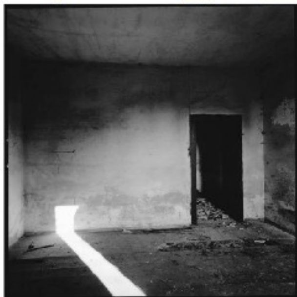
(van boven naar onder): erosie op een gevel in Cesena (1980), inrij in het huis van Guidi in Rontia (2016) en een beeld uit de sequentie in Preganziol (1983).

In 1983 maakte de bedachtzame fotograaf een korte kleuren- en zwart-witreeks in een lege kamer in Preganziol, met vier maakte muren en twee vensters die kruislings tegenover elkaar staan en het licht binnenlaten. In een serene beeldsequentie zien we het binnenvallende licht langzaam opschuiven langs de klamme wand. In het